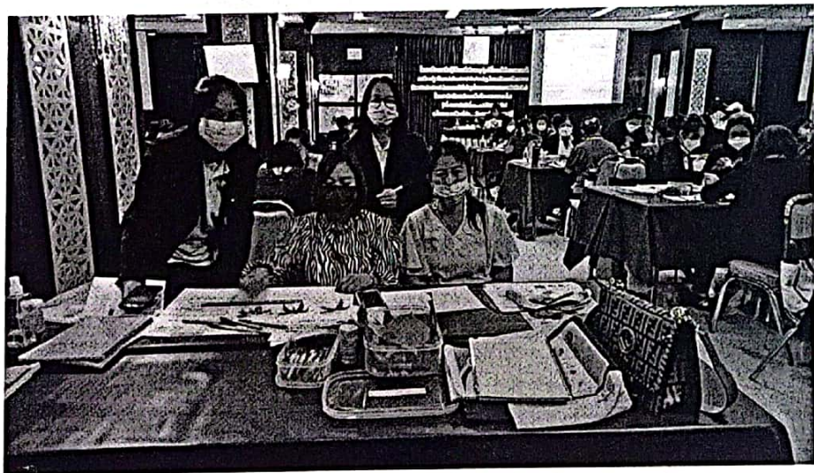
กิจกรรมโครงการฝึกอบรมเชิงปฏิบัติการเพื่อพัฒนาครูปฐมวัย