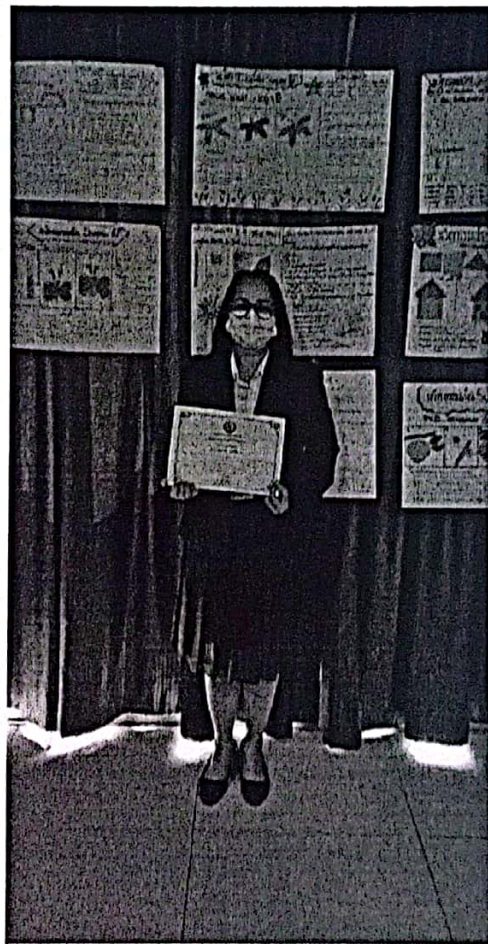
รับใบประกาศนียบัตรผู้เข้าร่วมกิจกรรมโครงการฝึกอบรมเชิงปฏิบัติการเพื่อพัฒนาครูผู้ช่วย