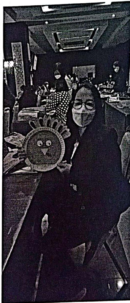
ร่วมกิจกรรมนวัตกรรม “สื่อสร้างสรรค์”